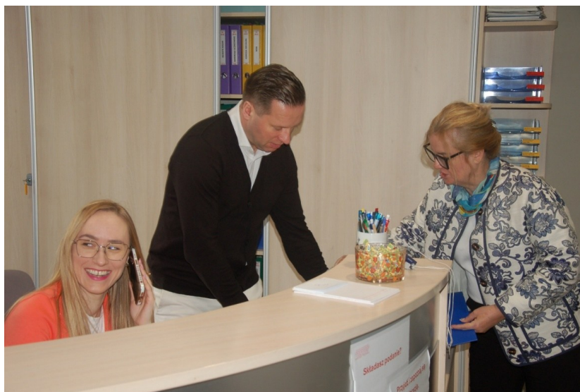
W sekretariacie praca wre...