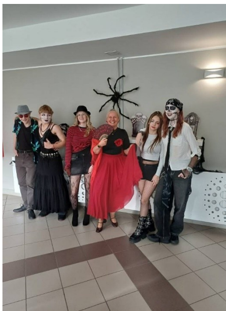
Szkoła w walentynkowo/halloweenowej odstonie.

W roku szkolnym 2025/2026 szkoła liczy 28 klas, do których uczęszcza 748 uczniów.