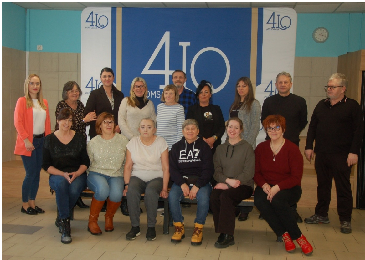
Pracownicy administracji i obsługi – XII 2025