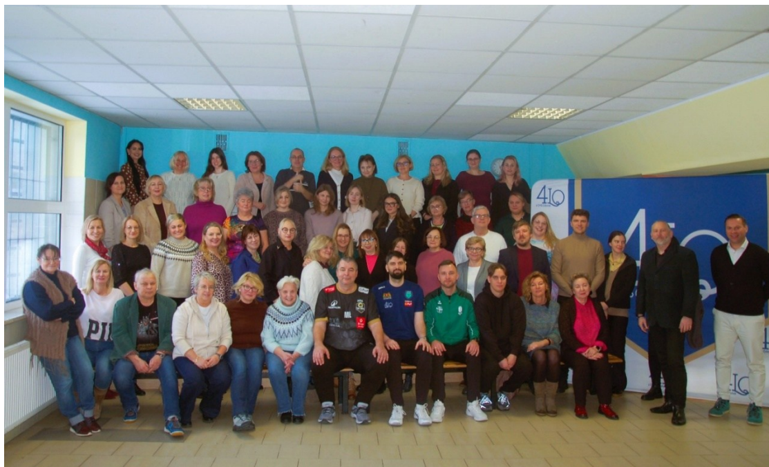
Grono pedagogiczne – grudzień 2025