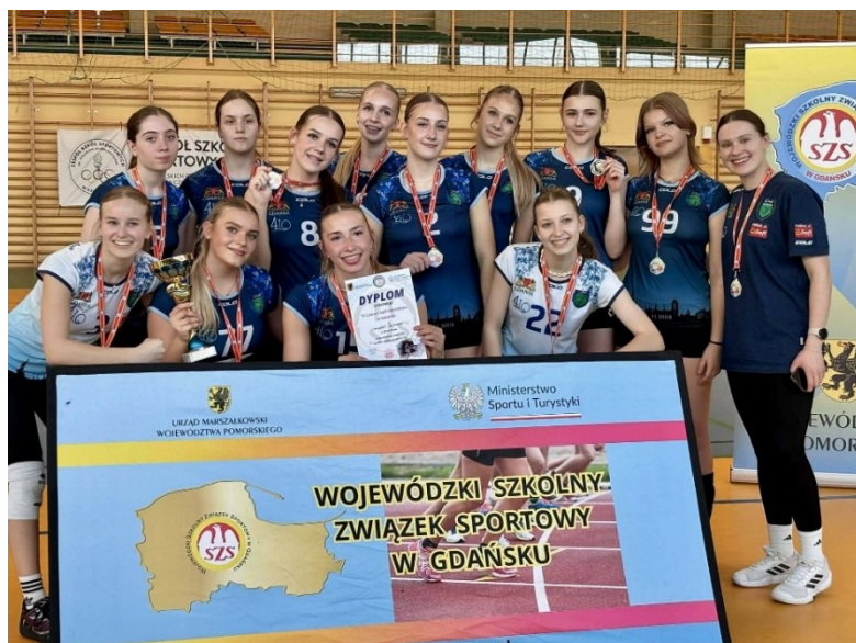
Pierwsze miejsce w Wojewódzkim Finale XXVI Licealiady w Piłce Siatkowej Dziewcząt, 26 lutego 2026