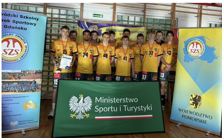
Pierwsze miejsce w Wojewódzkim Finale XXVI Licealiady w Piłce Siatkowej Chłopców – 26 lutego 2026

W 2019 roku do oferty IV LO klas dołączyła klasa medialna, pod patronatem Akademii Dynamiczna Tożsamość (adT) i klasa mediacyjna pod patronatem Polskiego Centrum Mediacji. Klasy przygotowują uczniów do pracy w mediach, dziennikarstwie i komunikacji społecznej. Uczniowie uczestniczą w praktycznych warsztatach z produkcji medialnej, obsługi kamer, montażu i marketingu a także uczą się tworzyć materiały prasowe, radiowe i telewizyjne oraz prowadzenia mediów społecznościowych.