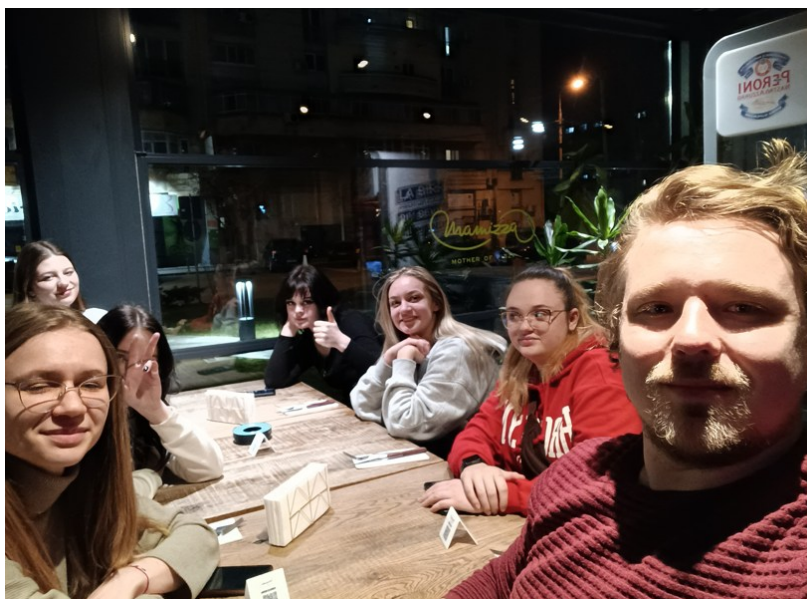
Projekt Erasmus+, wyjazd studyjny marzec 2023 r., nauczyciele i uczniowie IV LO, Bukareszt, Rumunia

Zdobywają w ten sposób nieocenione doświadczenie i wspaniałe znajomości na długie lata dorosłego życia.